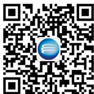
明阳集团招聘公众号

微信公众号: 搜索“明阳集团招聘”公众号或扫右侧二维码, 关注后点击“招聘” - “校园招聘”投递简历;